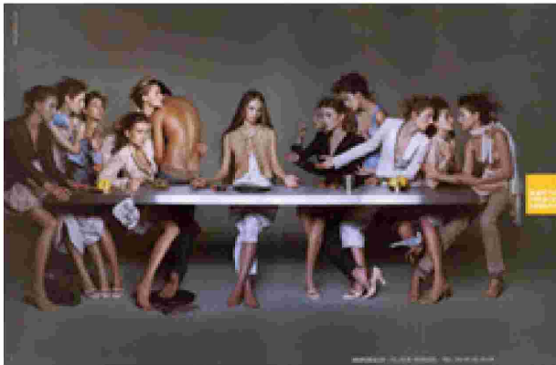
La última cena de Marithé François Girbaud (2005). Campaña Publicitaria de la Marca Benetton.

Como se puede observar en los dos ejemplos anteriores, el sentido de existencia de la Fotografía de la campaña de Benetton, no sería posible sin la existencia de lo que denominamos sistema “de origen”. Nótese que el Mural de Da Vinci es ampliamente reconocido, no solo por su valor estético sino también por su significado religioso. Para poder relacionar un sistema con otro, el interlocutor se ve en la obligación de conocer, no solo la obra de arte, sino también su contexto histórico y simbólico (ampliamente nutrido, por sesgos religiosos, culturales y hasta sociales). Lo que hay que observar, es que el proceso de complementación de contextos, está dado por la preservación de los elementos iconográficos. A pesar