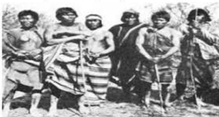
Fig. 2- Mocovíes

Antes de la llegada de los españoles vivían fundamentalmente de la caza y la recolección. Constituían un pueblo muy guerrero, que aprovechó el caballo traído por los europeos para atacar distintas ciudades.