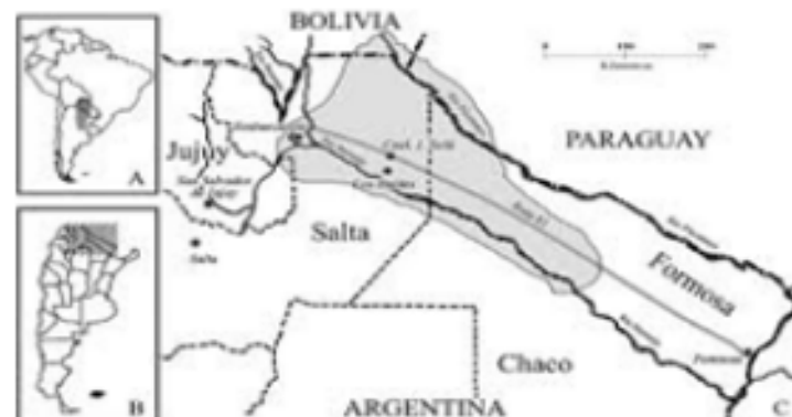
Fig.3. zonas habitadas por los wichís

Hacia inicios de 2005 los wichís habitan principalmente en el este del Departamento de Tarija, en Bolivia y en el Chaco salteño ubicado en el noreste de la de Provincia de Salta, República Argentina. Existen además asentamientos en el oeste de las provincias argentinas de la Provincia de Formosa, de la Provincia del Chaco y en el extremo noroeste de Provincia de Santiago del Estero y es posible que haya algunos en el extremo sudoeste del Chaco Boreal en el Paraguay, pero no fueron registrados por los últimos censos.