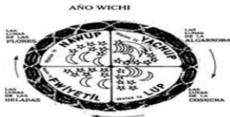
Fig.5- Calendario wichi

Los ciclos de obtención de recursos alimentarios significaron que organizaran su calendario de un modo circular: el inicio de año ( okä nek' chum ) se celebraba ritualmente en el tiempo que corresponde al mes de agosto, desde ese inicio de año sucedía la estación llamada nawup ("luna de las flores"), luego le seguía desde noviembre la yachup ("luna de las algarrobas"), tras ésta a fines del verano austral venía la estación lup ("luna de las cosechas"), siguiéndole la fwiyeti(up) ("luna de las heladas").