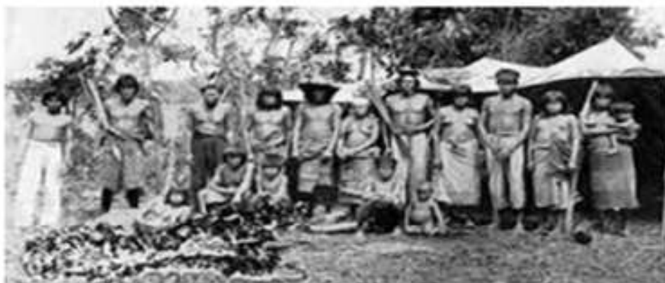
fig. 4- Los Wichís

La lengua wichí forma parte de la familia lingüística mataco-guaycurú , subfamilia mataco-mataguayo . Este grupo incluye a otras etnias: chorote , maká , chulupí , mataguayo y vejoce . En cuanto a éstos últimos su filiación con los wichís actuales (hacia 2006) es tan estrecha que se los considera simplemente como una parcialidad étnica.