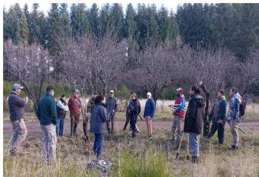
Figura 4. Intercambio de saberes durante la actividad del Módulo de Poda.

Estos resultados subrayan la relevancia de la estructura institucional del INTA en la creación de dinámicas de capacitación transformadoras, sustentadas en un acompañamiento técnico de cercanía. Los convenios de cooperación técnica entre INTA y el Registro Nacional de Trabajadores Rurales y Empleadores (RENATRE) apuestan a la capacitación y especialización de los trabajadores rurales. El accionar de la institución en este trayecto formativo ratifica la importancia de los marcos institucionales en la definición de estrategias y dinámicas de capacitación de las personas, en concordancia con lo planteado por Landini y Villafuerte-Almeida (2022).