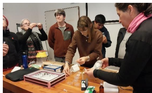
Figura 3. Trabajo en equipo a través del intercambio de saberes entre los participantes del curso Operario Frutícola calificado durante el módulo Sanidad vegetal. a) Reconocimiento de plagas en el aula. b) Colocación de trampas para monitoreo de plagas.