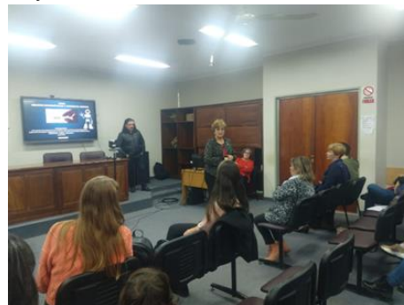
Figura 1 Charla de capacitación con directivos, docentes y auxiliares de las escuelas participantes del proyecto.