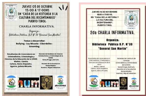
Figura 2 Invitaciones desde la Biblioteca Pública B.P. N°39 "General San Martín"

El proyecto "Hacia una juventud sin acoso" demostró ser una intervención significativa y valiosa en el ámbito educativo de las provincias de Chaco y Corrientes. A través de la implementación de talleres participativos y charlas de capacitación, se logró involucrar a una amplia gama de actores escolares, incluyendo estudiantes, docentes, directivos, auxiliares docentes y familias (figura 2).