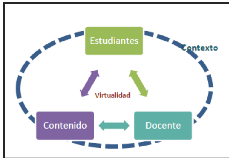
Figura 2. Tríada didáctica para pensar el proceso de enseñanza

El sujeto de enseñanza. En la propuesta presentada el docente asume un rol de orientador y acompañante del proceso de aprendizaje. Es el encargado de diseñar con antelación el escenario de trabajo demarcando un posible sendero cognitivo a transitar desde la resolución de la tarea. Como sostienen Mauri y Onrubia (2011) el profesor toma un rol de asesor asumiendo un perfil de intervención íntimamente relacionado a la necesidad y solicitud del estudiante, pero favoreciendo la implicancia del mismo en la tarea y en su proceso de aprendizaje.