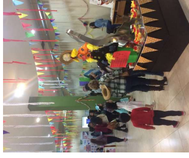
Más del decorado del hall central.