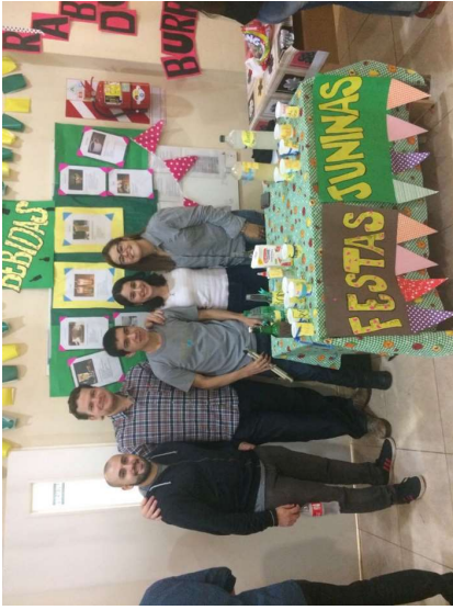
Grupo de alumnos de la Licenciatura en Psicología y Licenciatura en Nutrición presentando los alimentos y sus informaciones.