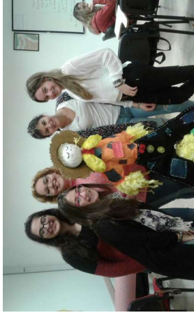
Grupo de alumnos con el tradicional muñeco “Caipira” que da la bienvenida al evento.

A continuación se exponen una serie de imágenes de la Festa Junina 2017 en el Hall Central de la Universidad de la Cuenca del Plata – Sede Posadas.