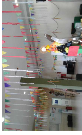
Parte del decorado del Hall central de la Sede Posadas de la Universidad de la Cuenca del Plata.