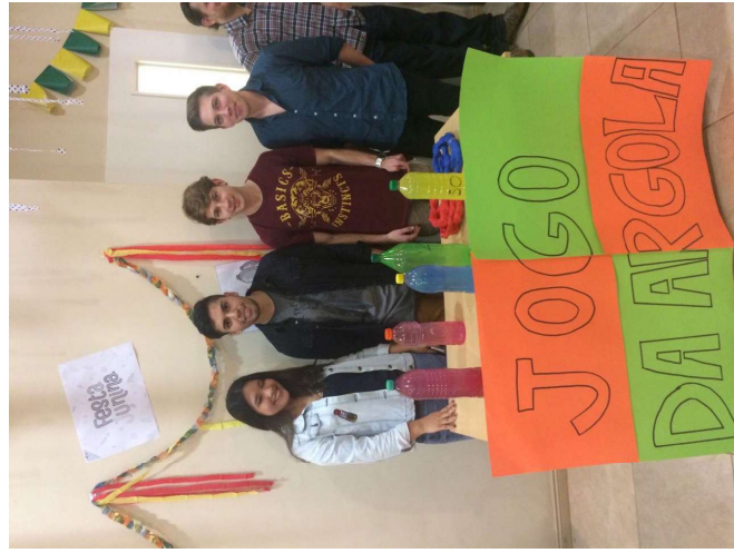
BARRACA, rincón de las Festas Juninas donde se puede jugar, saber el futuro, comprar comida, etc.