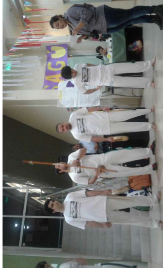
Y también hubo demostración de Capoeira, otra manifestación cultural.