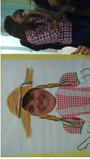
Como manifestación cultural, la Festa Junina invita a todos a participar y desestereotiparse, en este caso la Delegada Regional participando.